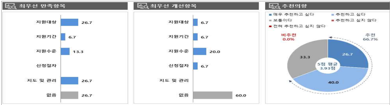
[그림 1] 고용장려금(용자)(고령자고용환경개선지원) 만족/개선 항목 및 추천 의향